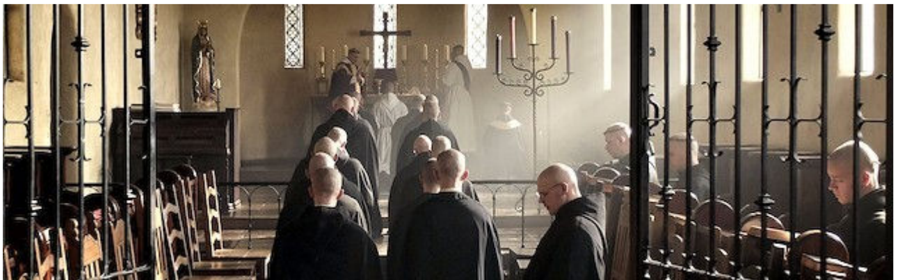
El culto divino fue el gran elemento civilizador de los benedictinos en la cristianización de Europa.